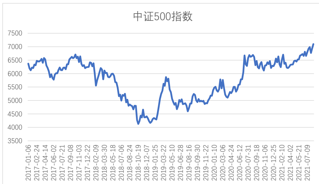
图 3-中证 500 指数市场表现